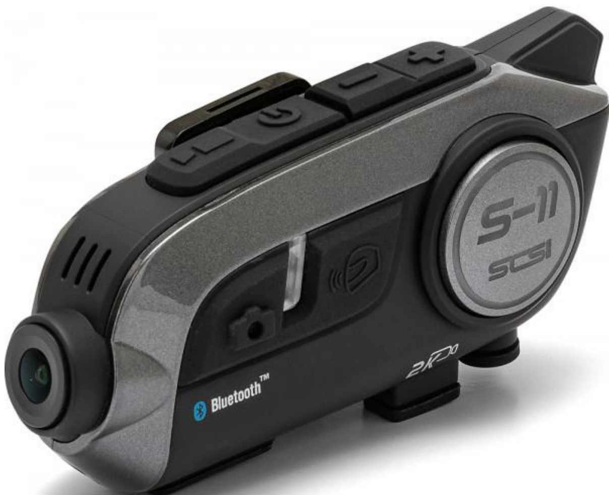
IMMAGINE DEL DISPOSITIVO

EVERT S.R.L. cap.soc.vers. 345.000,00 € REA LU 209802 Via delle Cerbaie 78 55011 Altopascio (LU) P.IVA 02248480465